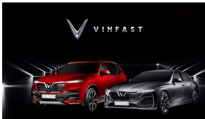
(左：SUV「LUX SA2.0」右：セダン「LUX A2.0」)

ベトナム不動産最大手ビングroupが、自動車製造に参入、自動車メーカー「ビンファスト」が誕生しました。国内工場にて2025年までに年間50万台を生産する計画を発表しています。